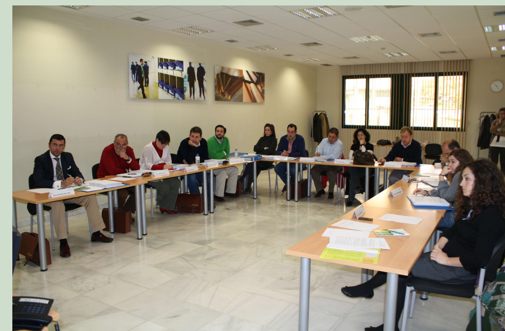
Los alumnos de la primera edición del Curso de Experto en Administración y Dirección de Fundaciones (EDAF).